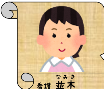
なみき 看護 並木

看護師として利用者の皆様の健康管理に努めていきたいと思っています。よろしくお願いいたします。