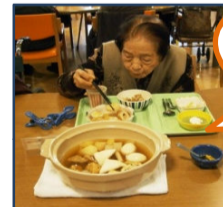
なにから 食べようかしら？