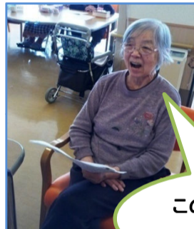
この曲なら昔良く 唄ったわ～