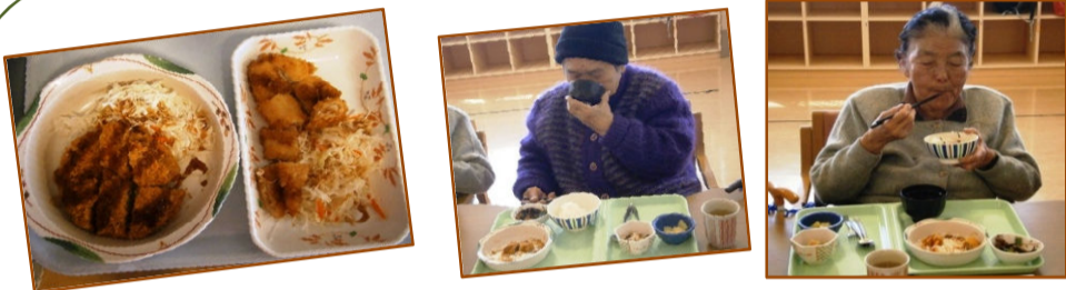
この日はメンチカツと白身魚のフライを選んで頂きました★