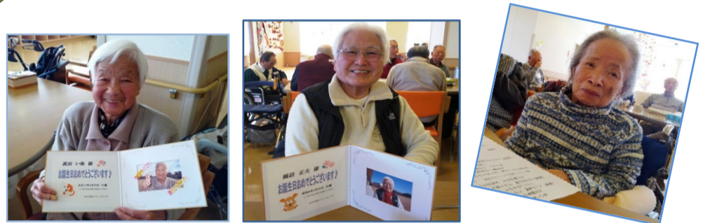
音楽のひろばと誕生日会での一コマです★