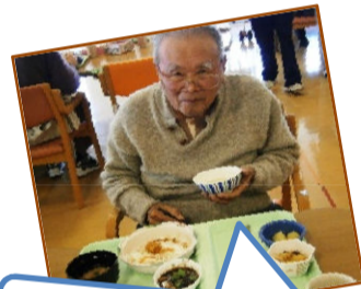
オレはメンチカツ♪

選択食が四月から始まります♪ 二種類の主菜から一つ選んで頂き 昼食に提供する予定です。 これによりイベント食は三月で 終了させていただきます。