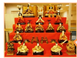
あさがおで飾った ひな人形です★