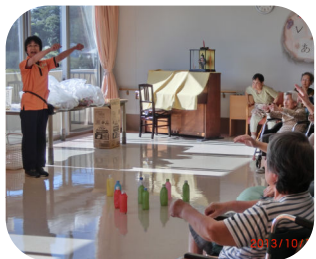
準備運動は歌謡体操♪