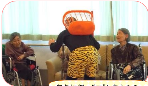
毎年恒例!“豆”と言う名の新聞紙ボールで鬼退治です!